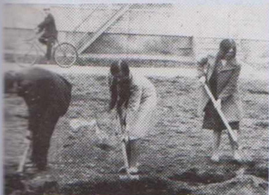
Шкільне життя ХХ століття