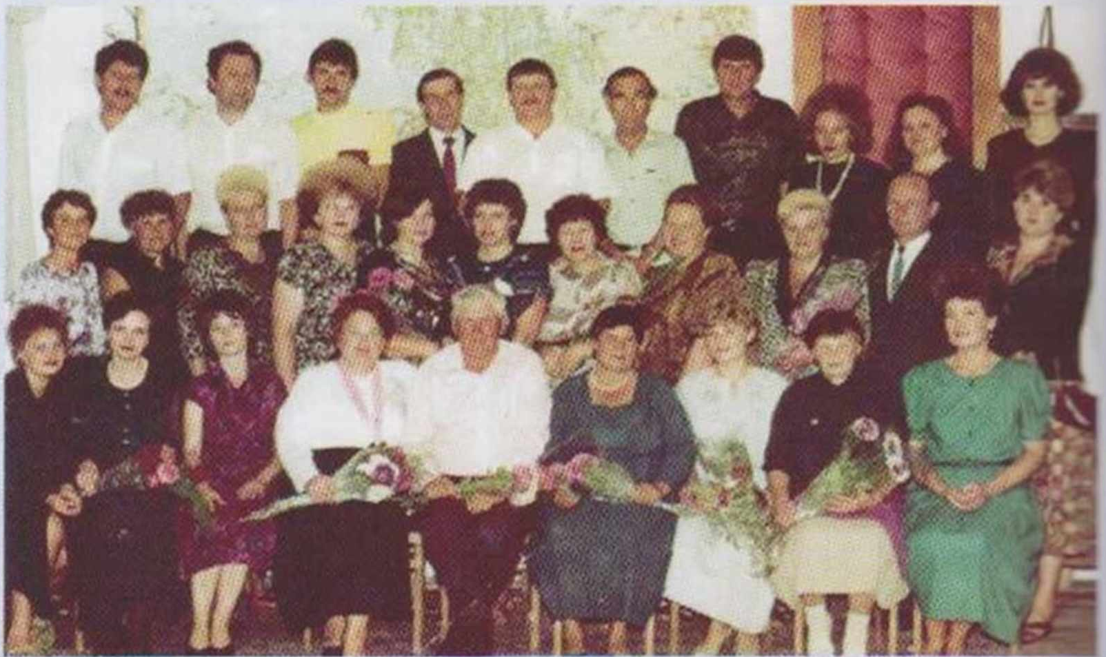
Завершився навчальний рік