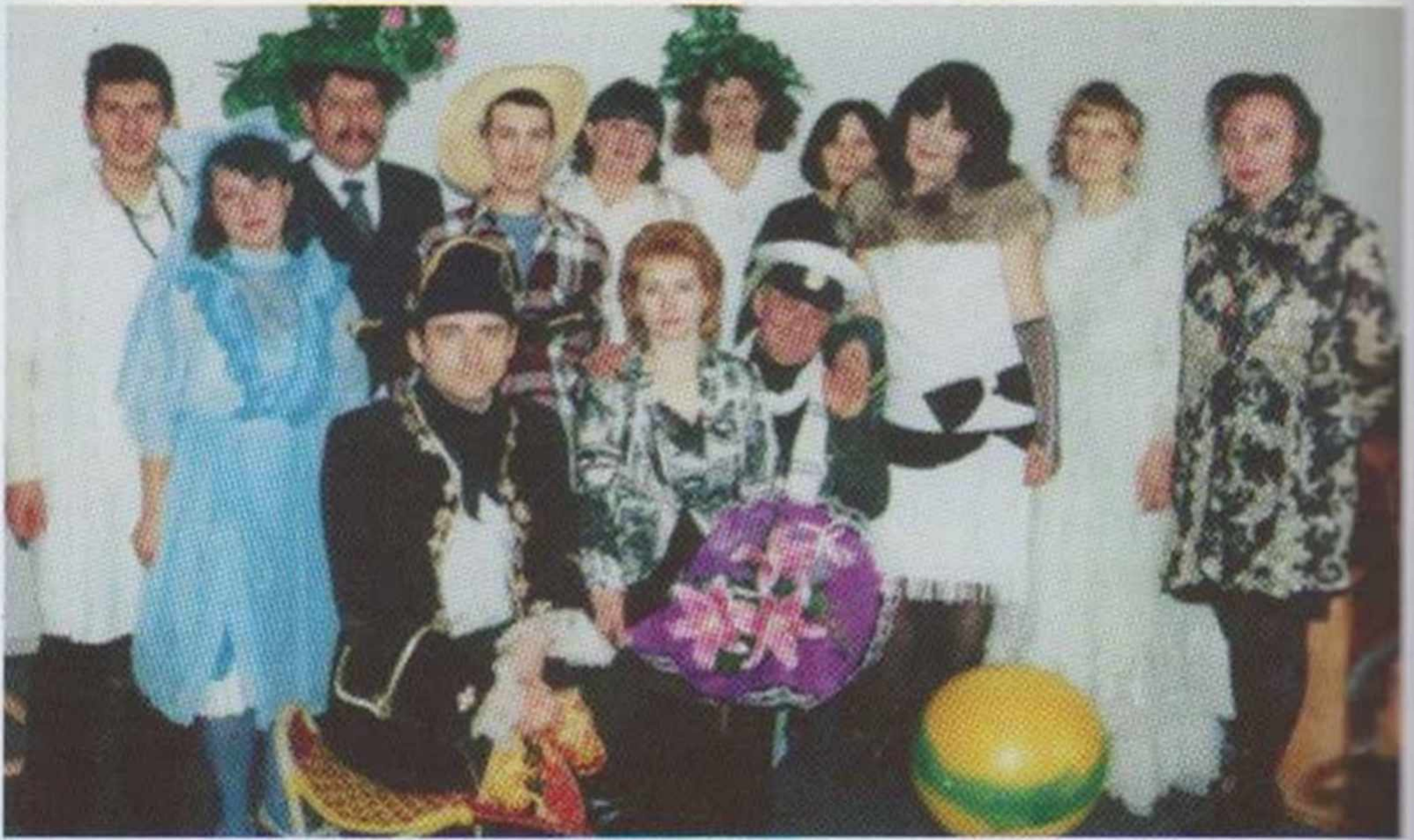
В години дозвілля